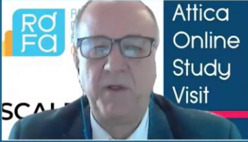
Attica Online Study Visit